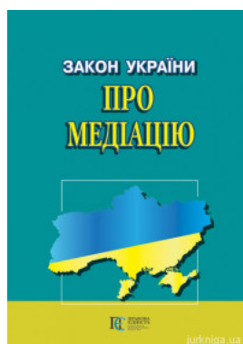
Закон України "Про медіацію"