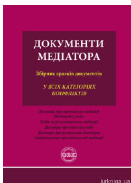
Документи медіатора: збірник зразків документів