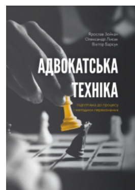
Адвокатська техніка (підготовка до процесу і методики переконання)