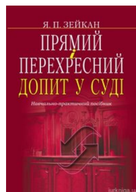
Прямий і перехресний допит у суді