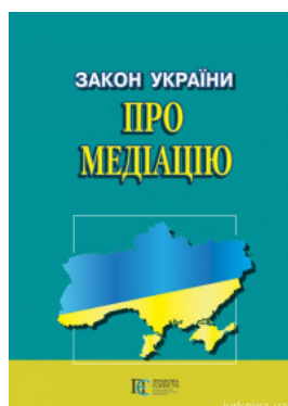
Закон України "Про медіацію". Алерта