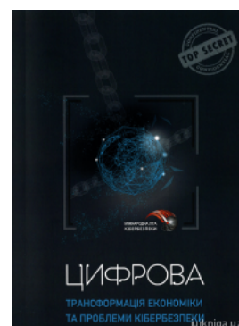
Цифрова трансформація економіки та проблеми кібербезпеки