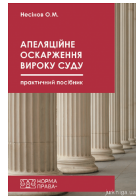
Апеляційне оскарження вироку суду. Практичний посібник