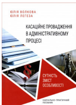
Касаційне провадження в адміністративному процесі: сутність, зміст, особливості

Перейти до галузі права Антимонопольне право