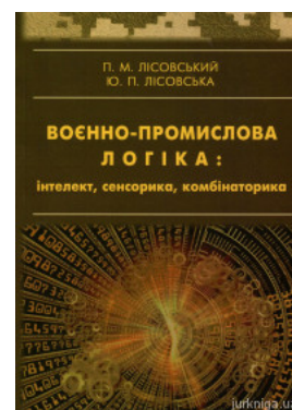
Воєнно-промислова логіка: інтелект, сенсорика, комбінаторика

Перейти до галузі права Конституційне право