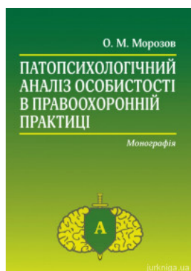
Патопсихологічний аналіз особистості в правоохоронній практиці