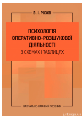
Психологія оперативно-розшукової діяльності в схемах і таблицях: навчально-наочний посібник