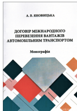
Договір міжнародного перевезення вантажів автомобільним транспортом