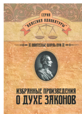
Избранные произведения о духе законов

Перейти до галузі права Філософія та психологія права