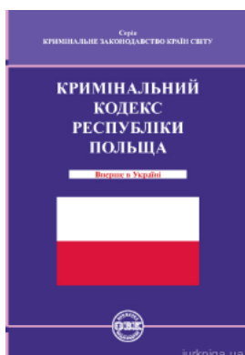
Кримінальний кодекс Республіки Польща