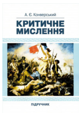
Критичне мислення. Підручник

Перейти до галузі права Міжнародне право