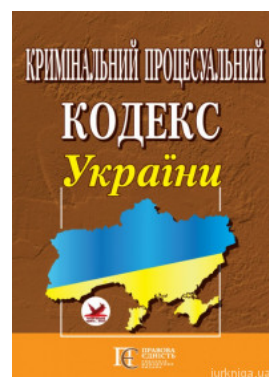
Кримінальний процесуальний кодекс України. Алерта