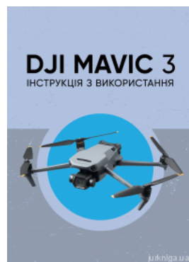
DJI MAVIC 3. Інструкція з використання