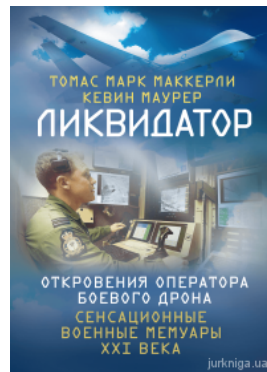
Ликвидатор. Откровения оператора боевого дрона