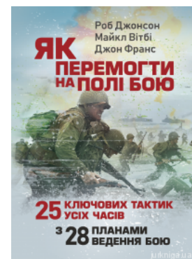
Як перемогти на полі бою. 25 ключових тактик усіх часів. З 28 планами ведення бою