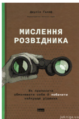
Мислення розвідника. Як припинити обманувати себе й побачити найкраще рішення