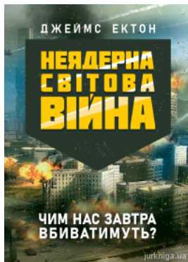
Неядерна світова війна. Чим нас завтра вбиватимуть?