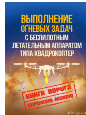
Выполнение огневых задач с беспилотным летательным аппаратом (БПЛА) типа квадрокоптер. Книга ворога ворожою мовою