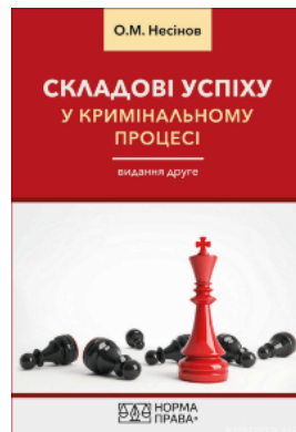
Складові успіху у кримінальному процесі. Видання друге