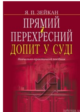
Прямий і перехресний допит у суді