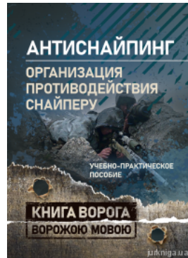
"Антиснайпинг" (організація протидії снайперу). Книга ворога ворожою мовою