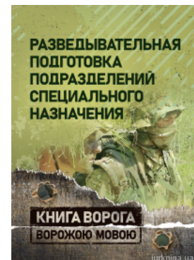
Розвідувальна підготовка підрозділів спеціального призначення. Книга ворога ворожою мовою