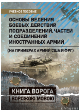
Основи ведення бойових дій підрозділів, частин і з'єдинень іноземних армій (на прикладах армій США і ФРГ). Книга ворога ворожою мовою