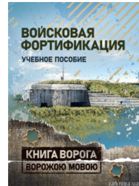
Військова фортифікація. Книга ворога ворожою мовою