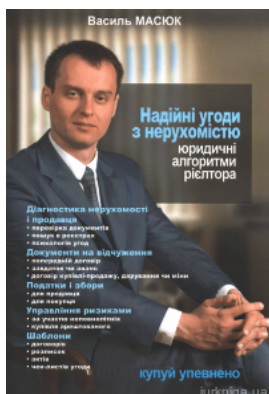
Надійні угоди з нерухомістю. Юридичні алгоритми ріелтора

Перейти до галузі права Право нерухомості