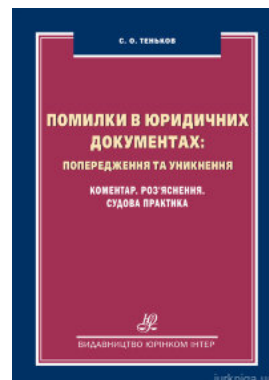
Помилки в юридичних документах: попередження та уникнення. Коментар, роз'яснення, судова практика