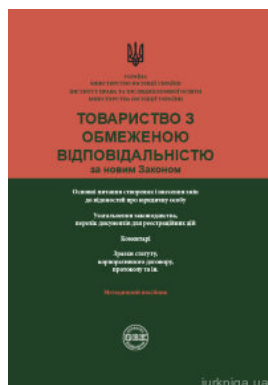
Товариство з обмеженою відповідальністю за новим законом