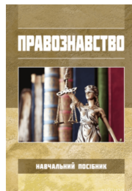
Правознавство. Навчальний посібник