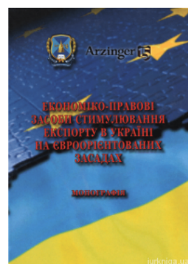
Економіко-правові засоби стимулювання експорту в Україні на євроорієнтованих засадах