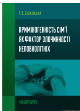
Криміногенність сім'ї як фактор злочинності неповнолітніх