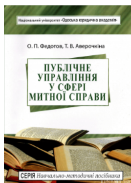
Публічне управління у сфері митної справи. Навчально-методичний посібник