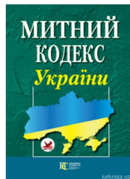
Митний кодекс України. Алерта