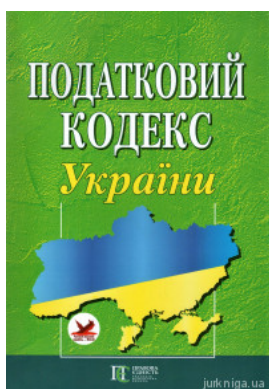
Податковий кодекс України. Алерта