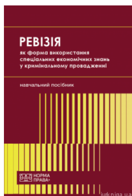
Ревізія як форма використання спеціальних економічних знань у кримінальному провадженні