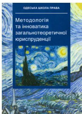
Методологія та інноватика загальнотеоретичної юриспруденції