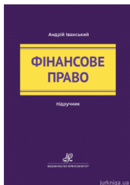
Фінансове право. Підручник