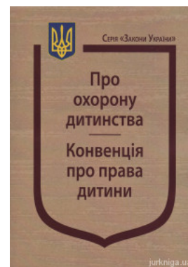
Закон України “Про охорону дитинства”, Конвенція про права дитини