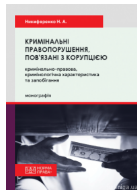
Кримінальні правопорушення, пов'язані з корупцією: кримінально-правова, кримінологічна характеристика та запобігання