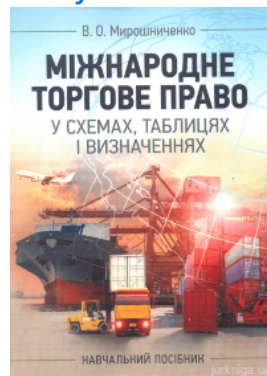
Міжнародне торгове право у схемах, таблицях і визначеннях