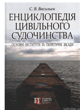
Енциклопедія цивільного судочинства: основні інститути та теоретичні засади

Перейти до галузі права Міжнародне право