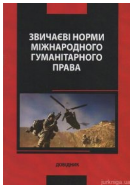
Звичаєві норми міжнародного гуманітарного права