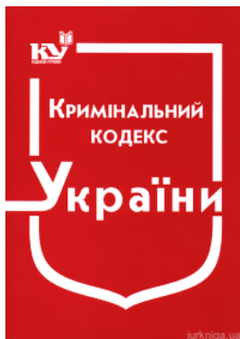
Кримінальний кодекс України