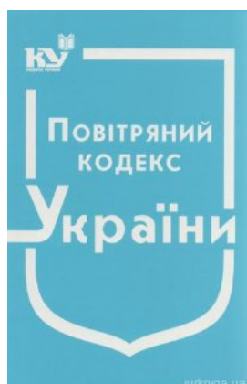
Повітряний кодекс України