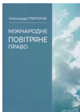
Міжнародне повітряне право