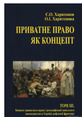
Приватне право як концепт. Том 3. Концепт приватного права і рекодифікації цивільного законодавства в Україні: рефлексії фронтиру

Перейти до галузі права Міжнародне право