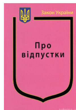
Закон України "Про відпустки"