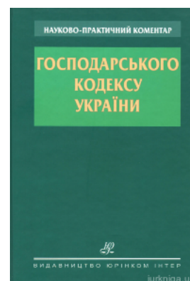
Науково-практичний коментар Господарського кодексу України

Перейти до галузі права Міжнародне право