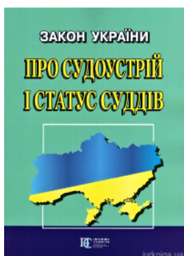
Закон України "Про судоустрій і статус суддів". Алерта