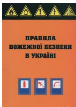
Правила пожежної безпеки в Україні