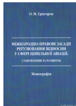
Міжнародно-правові засади регулювання відносин у сфері цивільної авіації: становлення та розвиток