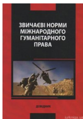
Звичаяєві норми міжнародного гуманітарного права