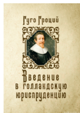
Введение в голландскую юриспруденцию. Гуго Гроций