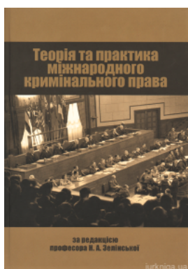
Теорія та практика міжнародного кримінального права