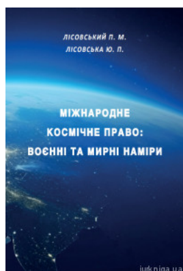
Міжнародне космічне право: воєнні та мирні наміри