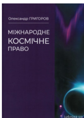
Міжнародне космічне право