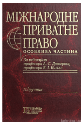
Міжнародне приватне право. Особлива частина