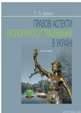
Правові аспекти екологічного страхування в Україні