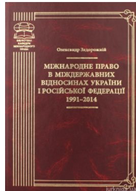
Міжнародне право в міждержавних відносинах України і Російської Федерації 1991–2014