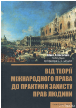
Від теорії міжнародного права до практики захисту прав людини