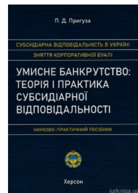
Умисне банкрутство: теорія і практика субсидіарної відповідальності. Науково-практичний посібник

Перейти до галузі права Международное право