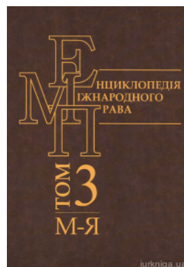
Енциклопедія міжнародного права. Том 3