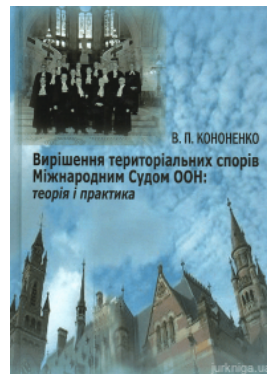
Вирішення територіальних спорів Міжнародним Судом ООН: теорія і практика