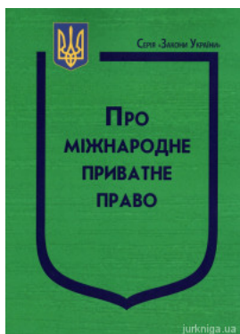
Закон України "Про міжнародне приватне право"