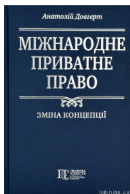
Міжнародне приватне право: зміна концепції