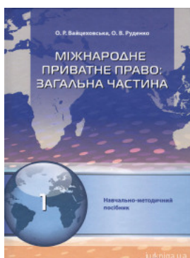
Міжнародне приватне право. Загальна частина