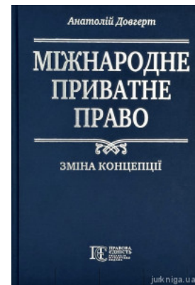
Міжнародне приватне право: зміна концепції

Перейти до галузі права Міжнародне приватне право