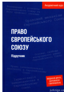
Право Європейського Союзу. Академічний курс