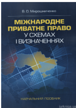
Міжнародне приватне право у схемах і визначеннях