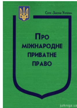
Закон України "Про міжнародне приватне право"