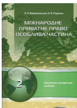
Міжнародне приватне право. Особлива частина