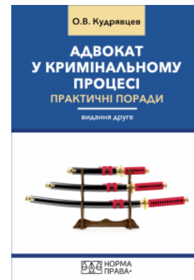
Адвокат у кримінальному процесі. Практичні поради. Видання друге

Перейти до галузі права Міжнародне приватне право