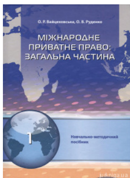
Міжнародне приватне право. Загальна частина