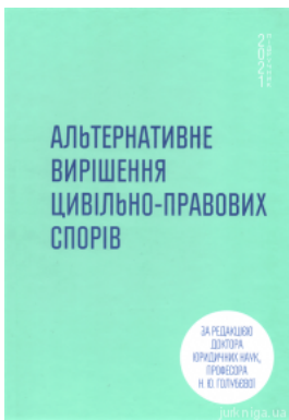
Альтернативне вирішення цивільно-правових спорів