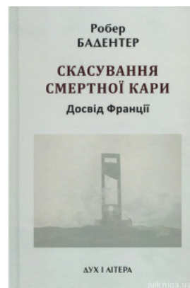
Скасування смертної кари. Досвід Франції

Перейти до галузі права Міжнародне приватне право