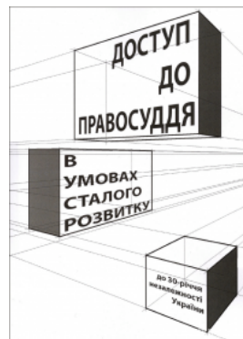
Доступ до правосуддя в умовах сталого розвитку