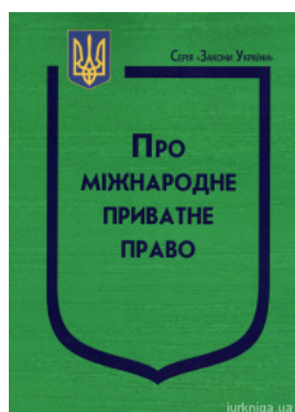
Закон України "Про міжнародне приватне право"