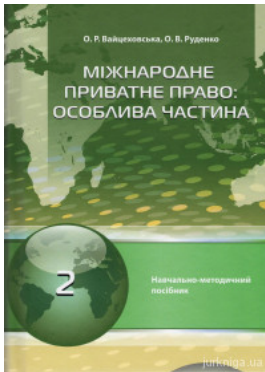
Міжнародне приватне право. Особлива частина