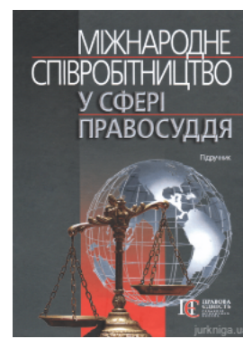
Міжнародне співробітництво у сфері правосуддя. Підручник

Перейти до галузі права Кримінальне право та процес