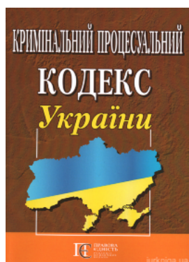
Кримінальний процесуальний кодекс України. Алерта