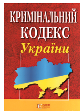
Кримінальний кодекс України. Алерта