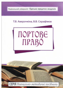
Портове право. Навчально-методичний посібник