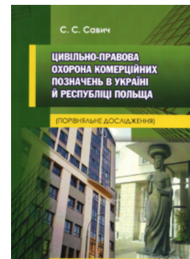
Цивільно-правова охорона комерційних позначень в Україні й Республіці Польща