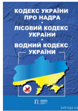
Кодекс України про надра. Лісовий кодекс України. Водний кодекс України. Алерта