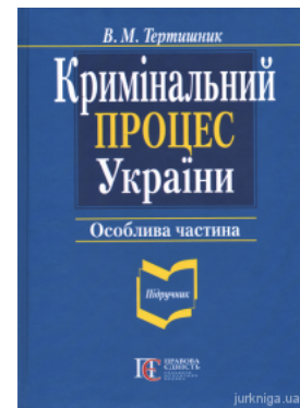
Кримінальний процес України. Особлива частина

Перейти до галузі права Міжнародне право