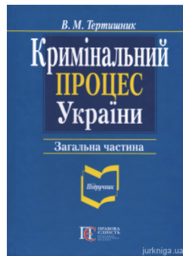
Кримінальний процес України. Загальна частина