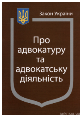
Закон України "Про адвокатуру та адвокатську діяльність"