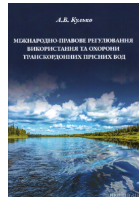
Міжнародно-правове регулювання використання та охорони транскордонних прісних вод