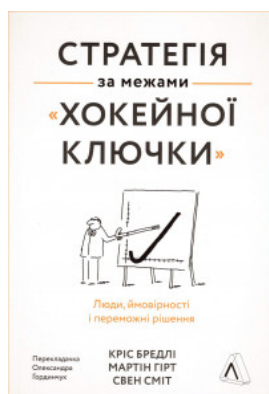
Стратегія за межами "хокейної ключки". Люди, ймовірності і переможні рішення