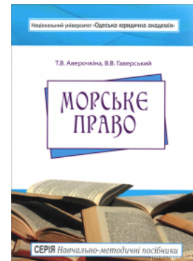
Морське право. Навчально-методичний посібник