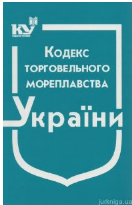
Кодекс торговельного мореплавства України