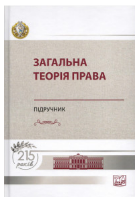
Загальна теорія права. Підручник