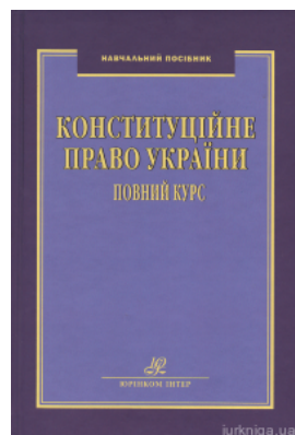
Конституційне право України. Повний курс