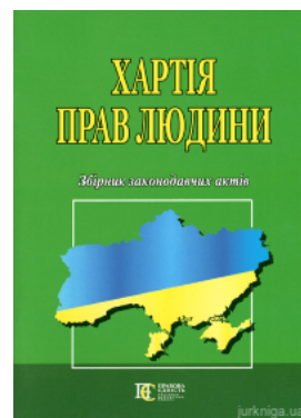
Хартія прав людини. Збірник законодавчих актів. Алерта

Перейти до галузі права Конституційне право