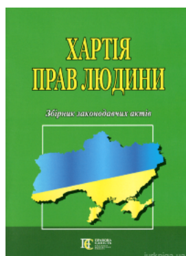
Хартія прав людини. Збірник законодавчих актів. Алерта