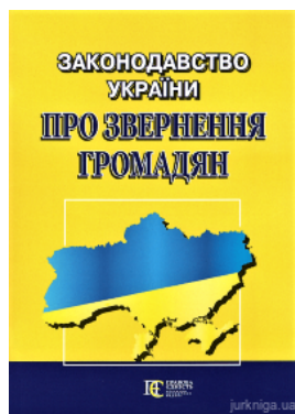
Законодавство України про звернення громадян: збірник законодавчих актів. Алерта