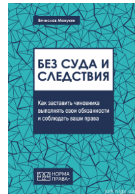
Без суда и следствия