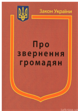
Закон України "Про звернення громадян"