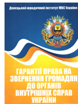
Гарантії права на звернення громадян до органів внутрішніх справ України

Перейти до галузі права Конституційне право