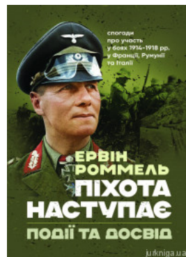
Піхота наступає. Події та досвід. Спогади про участь у боях 1914-1918 роках у Франції, Румунії та Італії