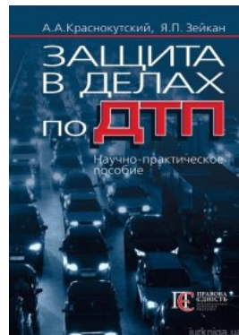
Защита в делах по ДТП Науч.-практ. пособ