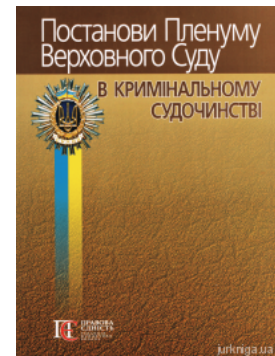
Постанови Пленуму Верховного Суду в кримінальному судочинстві