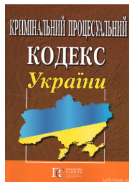
Кримінальний процесуальний кодекс України. Алерта