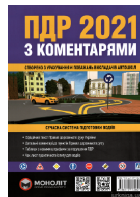
ПДР України 2021 з коментарями

Перейти до галузі права Кримінальное право и процесс