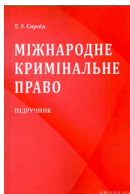
Міжнародне кримінальне право. Видання друге