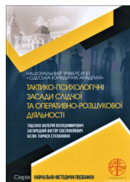
Тактико-психологічні засади слідчої та оперативно-розшукової діяльності