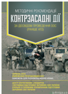
Методичні рекомендації "Контрзасадні дії" (за досвідом проведення ООС (раніше АТО))