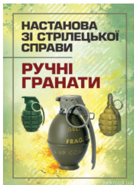
Настанова зі стрілецької справи. Ручні гранати