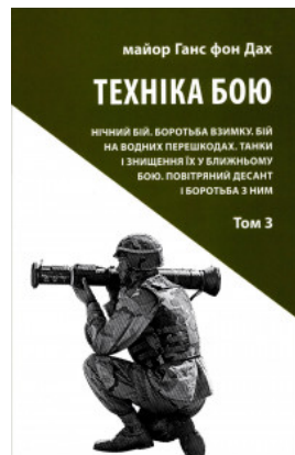
Техніка бою. Нічний бій. Боротьба взимку. Бій на водних перешкодах. Танки і знищення їх у ближньому бою. Повітряний десант і боротьба з ним. Том 3