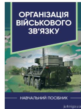
Організація військового зв'язку. Навчальний посібник