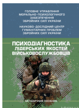
Психодіагностика лідерських якостей військовослужбовців