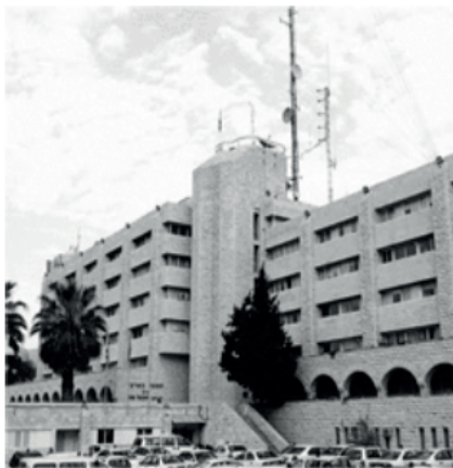
Головний штаб поліції Ізраїлю в Єрусалимі

налістів, розосереджені по території країни. Сьогодні в Єрусалимі 12 першокласних лабораторій, з яких лише одна – та, що займається виявленням невидимих слідів рук – оперативна, що несе цілодобове чергування. У ній-то я і прослужив понад 25 років.