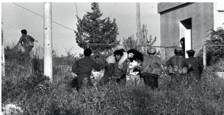
Трагедія в Маалот

Ізраїльська криміналістична служба існує у своєму сучасному вигляді з 1974 р. Тоді, у травні, група палестинських терористів захопила школу в містечку Маалот на півночі країни. Унаслідок запізнілого і невдалого штурму школи армійським спецназом 25 зі 115 школярів-заручників загинули.