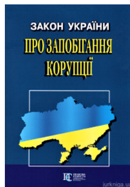
Закон України "Про запобігання корупції". Алерта