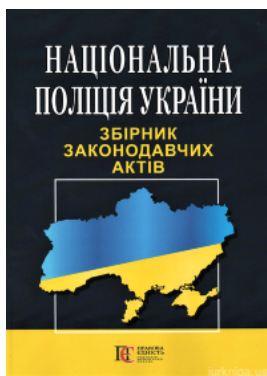
Національна поліція України. Збірник законодавчих актів. Алерта