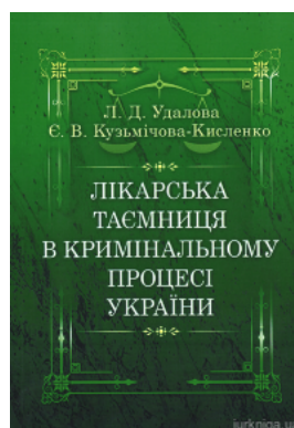
Лікарська таємниця в кримінальному процесі України

Перейти до галузі права Кримінальне право та процес