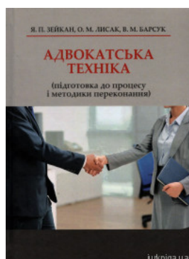
Адвокатська техніка (підготовка до процесу і методики переконання)