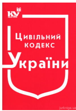
Цивільний Кодекс України