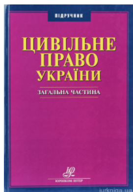
Цивільне право України. Загальна частина. Підручник