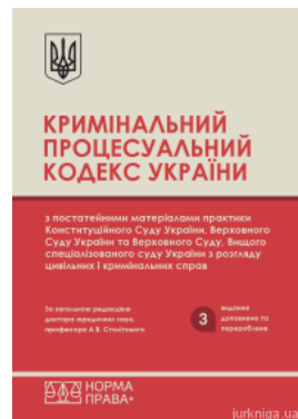
Кримінальний процесуальний кодекс України з постійними матеріалами практики Конституційного Суду України, Верховного Суду України та Верховного...