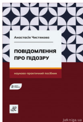
Повідомлення про підозру. Видання друге