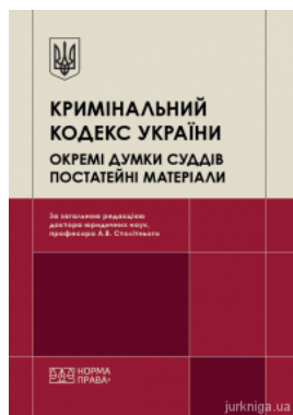
Кримінальний кодекс України. Окремі думки суддів. Постатейні матеріали