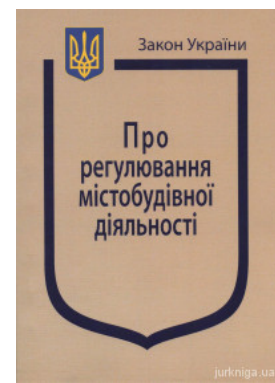
Закон України "Про регулювання містобудівної діяльності"