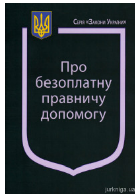
Закон України "Про безоплатну правничу допомогу"