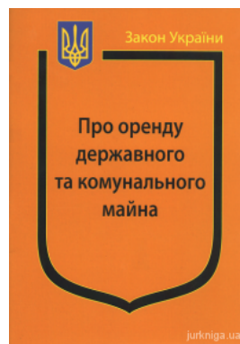
Закон України "Про оренду державного та комунального майна"