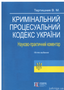
Науково-практичний коментар Кримінального процесуального кодексу України. Видання 18-те