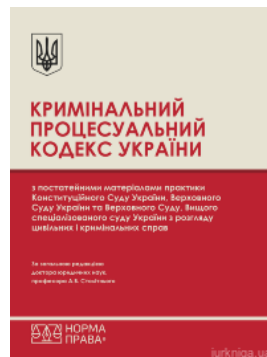
Кримінальний процесуальний кодекс України з постатейними матеріалами практики Конституційного Суду України, Верховного Суду України та Верховного...