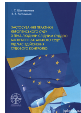
Застосування практики Європейського суду з прав людини слідчим суддею місцевого загального суду під час здійснення судового контролю

Перейти до галузі права Громадянське право и процес