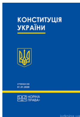
Конституція України. Норма права