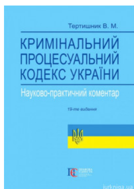
Науково-практичний коментар Кримінального процесуального кодексу України. Видання 19-те